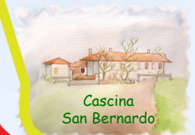
Cascina San Bernardo