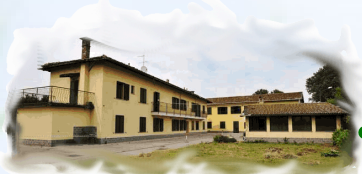
Casa Chiaravalle Immobile sequestrato alla mafia