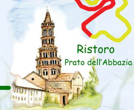
Ristoro Prato dell'Abbazia